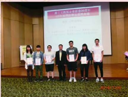
▲周董事長頒發大學助學金