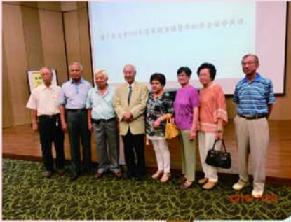
▲廖一久院士和高 中同學合影