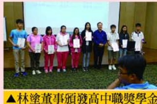
▲林塗董事頒發高中職獎學金