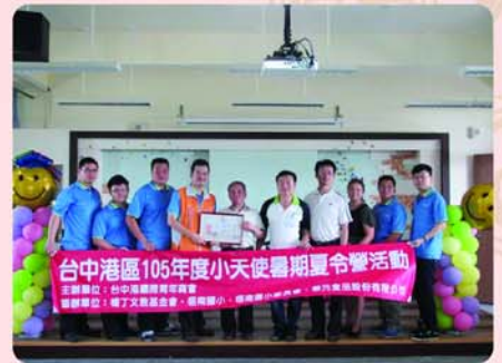
▲台中港青商會致贈本會協辦[台中港區小天使活動]感謝狀。