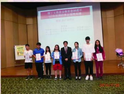
▲清水高中賴校長頒發高中職助學金