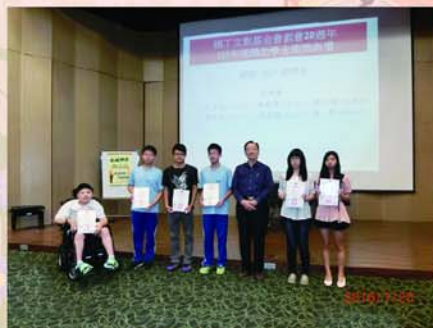
▲林塗董事頒發高中職助學金