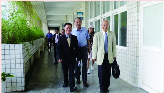
◀廖一久院士和貴賓合影