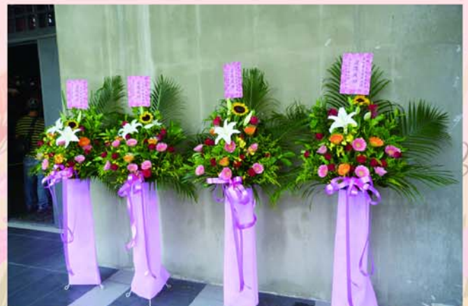
▲感謝清水高中第四屆同學會致贈花籃