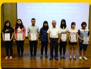
▲卓文川董事頒發大學助學金