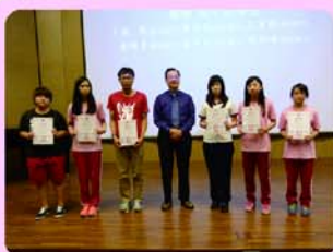
▲林塗董事頒發高中職助學金