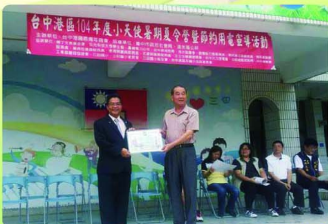
▲台中港青商會致贈本會協辦[台中港區小天使活動]感謝狀