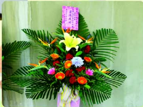
▶ 感謝清水高中第四屆同學會致贈花籃