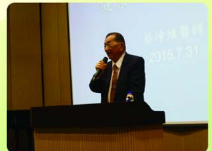
▲王董事長致歡迎詞