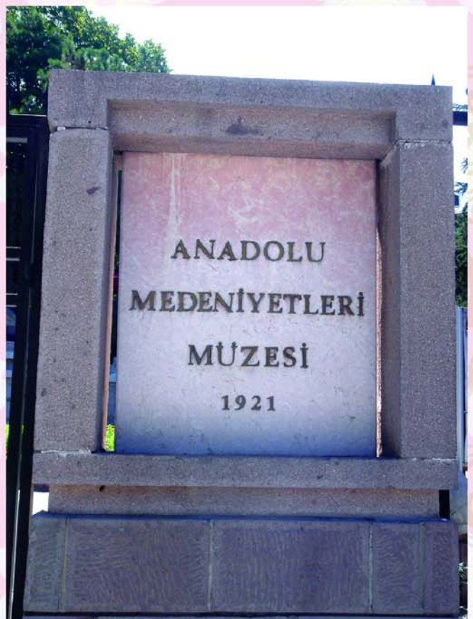
▲圖 9-博物館早在 1921 年創始於安卡拉的阿卡雷 (Akkale)

Civilisations) 建於 1493 年，博物館建築原址本是 15 世紀時鄂圖曼帝國首相穆哈默德·帕夏 (Mahmet Pasa) 主持修建的市集與旅店，不幸毀於 1881 年的大火，在更動部分設計之後，於廢墟之上重建爲今日的規模(圖 8)。安納托利亞文明博物館名稱意味著收藏品多半以安納托利亞這塊土地上的古代歷史爲主軸。博物館本身的建築是一