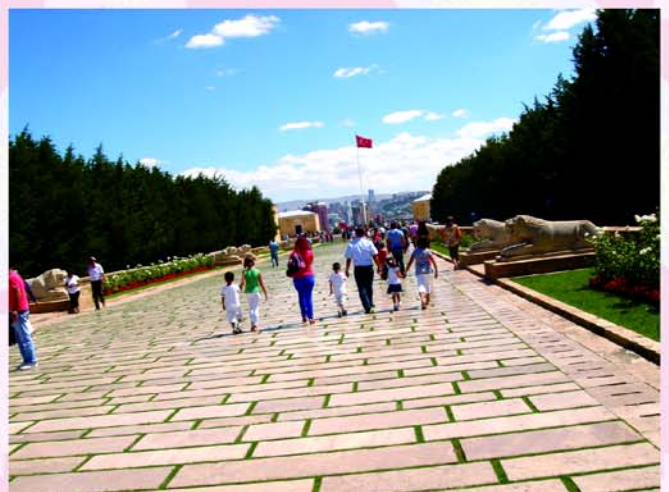
▲圖 5-紀念館外的廣場