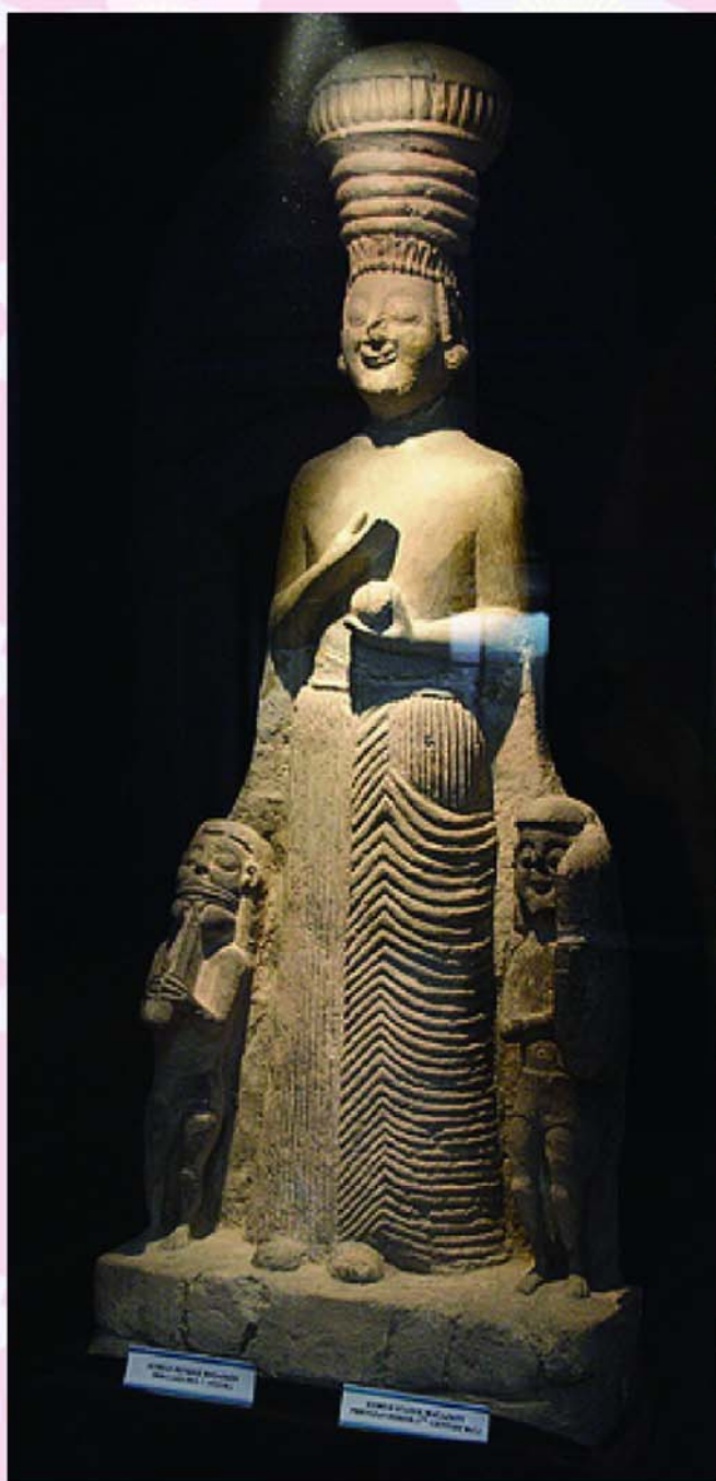
▲圖 17-Kybele statue