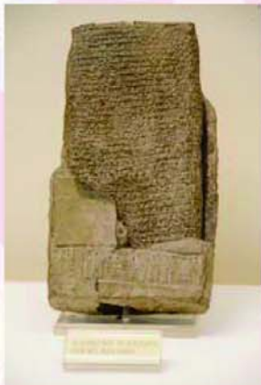
▲圖 13-加上封套的泥版書