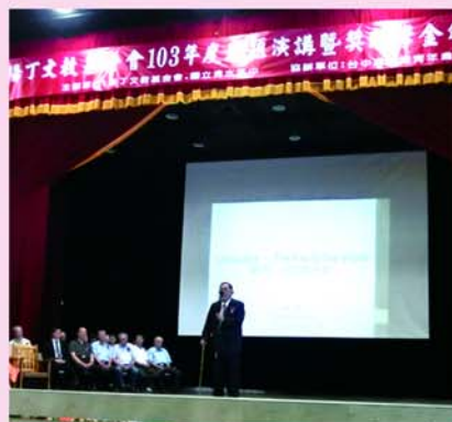
▲本會王董事長致歡迎詞