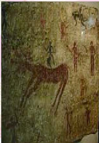
▲圖 10-新石器時代的壁畫

西元前兩千年，亞述人進入西利西亞 (Cilicia)，古代安那托利亞往敘利亞的必經之地與安那托利亞人進行貿易，留下許多以楔形文字刻寫的泥版文件(圖 13)，有些還加上封套與印章-這是