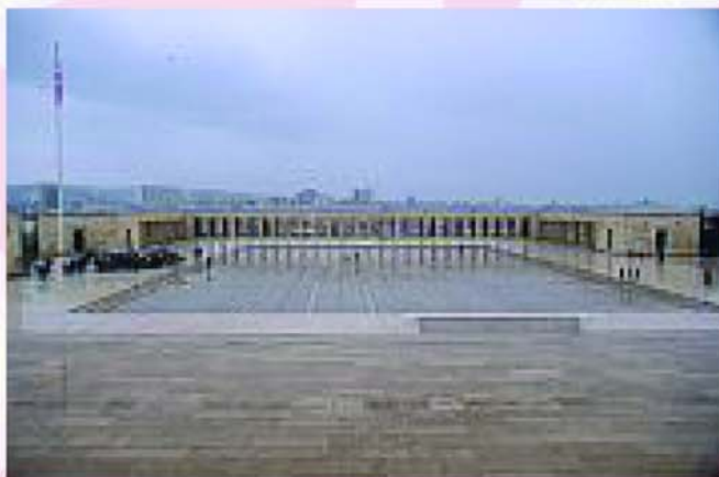
▲圖 4-紀念館外的廣場