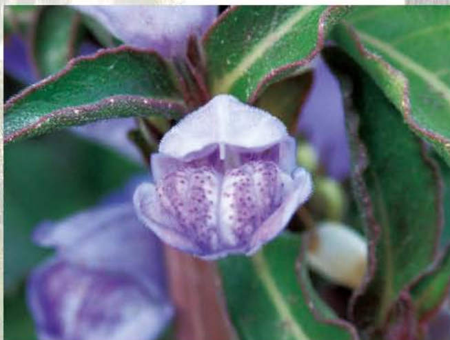
台灣特有植物-大安水蓼衣

高美溼地在中央研究院動物研究所、東海大學生物系、台中縣政府農業局、高美地區民眾及牛罵頭文化協進會等保育團體與單位努力之下，歷經十幾年（1990-2006），民國93年9月29日正式由台中縣政府公告劃設爲「高美野生動物保護區」，面積廣達701.3公頃，未來大家將依野生動物保育法規定，進行相關的經營管理與保育研究等計劃，期待我們可以與大自然和平共存，讓這些候鳥每年都會選擇再飛回到這些棲地，和我們重逢，這不僅是牠們歸來的承諾，也是人類歡迎牠們回娘家做客的承諾。