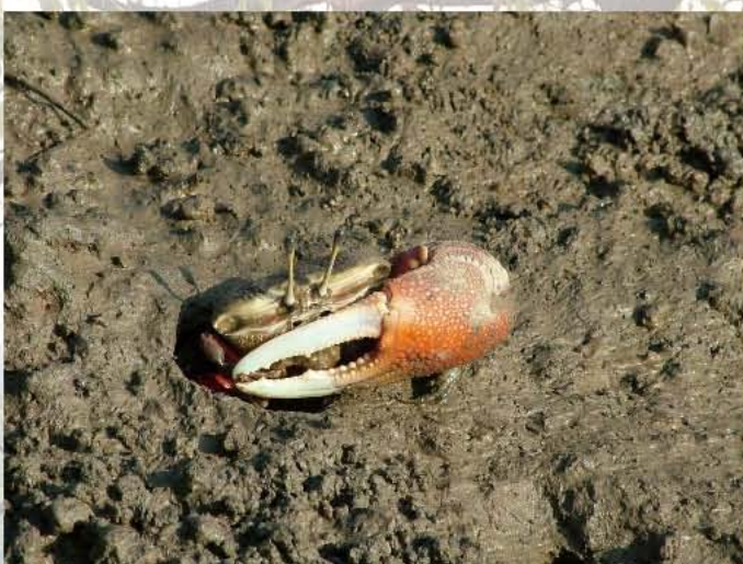
灘地的提琴手-弧邊招潮蟹