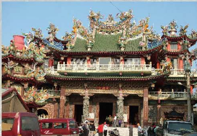
高美地區的信仰中心-文興宮

文興宮位於高西里，即知名高美溼地的東側，主祀溫、蕭、薛三府王爺，右殿奉祀朱、李、池三府王爺，左殿奉祀李、萬、金三府王爺，陪祀為中壇元帥三太子，至今已有三百四十多年歷史，源自泉州有放王船習俗，有日午時無人駕駛王船代天巡狩三府王爺船上有白靈雞及神羊，炊食器具俱全，停靠在今海水浴場南方約一百多公尺處，當地居民在此建造簡廟祭祀船頭公（站在前方指引方向）、目頭公（站在後面掌舵），以茲感恩及留存紀念。