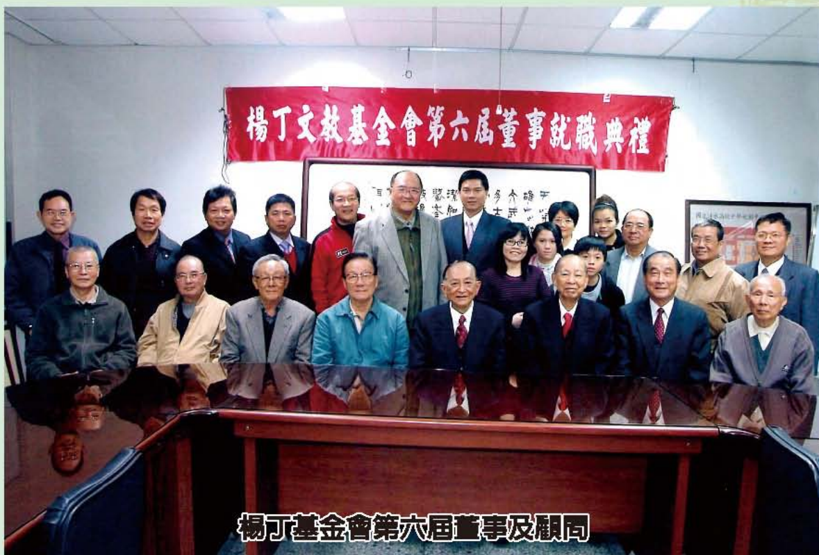
楊丁基金會第六屆董事及顧問