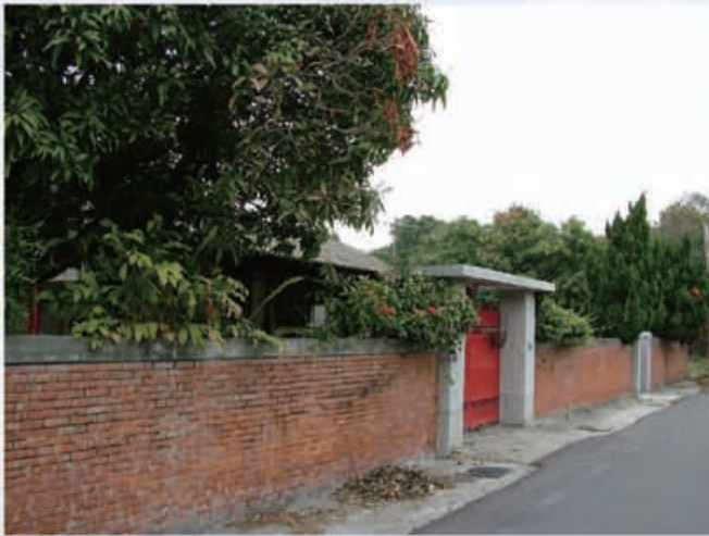
眷村文化將隨著拆遷而逐漸消失

清水地區從民國三十八年開始先後成立了忠勇村、信義村、和平村、陽明新村、果貿一村、銀聯二村及慈恩二十村等七個眷村，當年政府選擇了離清水鬧區較遠的社區成立，舊的眷村利用原日治時代所遺留下來的軍用或公務宿舍整理沿用，新的眷村則重新規劃興建使用，當時興建的經費由婦聯會號召銀行、水果貿易商等企業界捐獻而來，每一個眷村均成立自治委員會，都有一套屬於自己的管理與維護辦法。眷村的建置對於當年清水的經濟及地區的繁榮貢獻良多，而這麼多年來，眷村文化早就與在地文化融合在一起，眷村的饅頭、涼麵、麻醬麵、水餃、酸辣湯等美食文化，早就成為清水人生活當中重要的民生食物，因此清