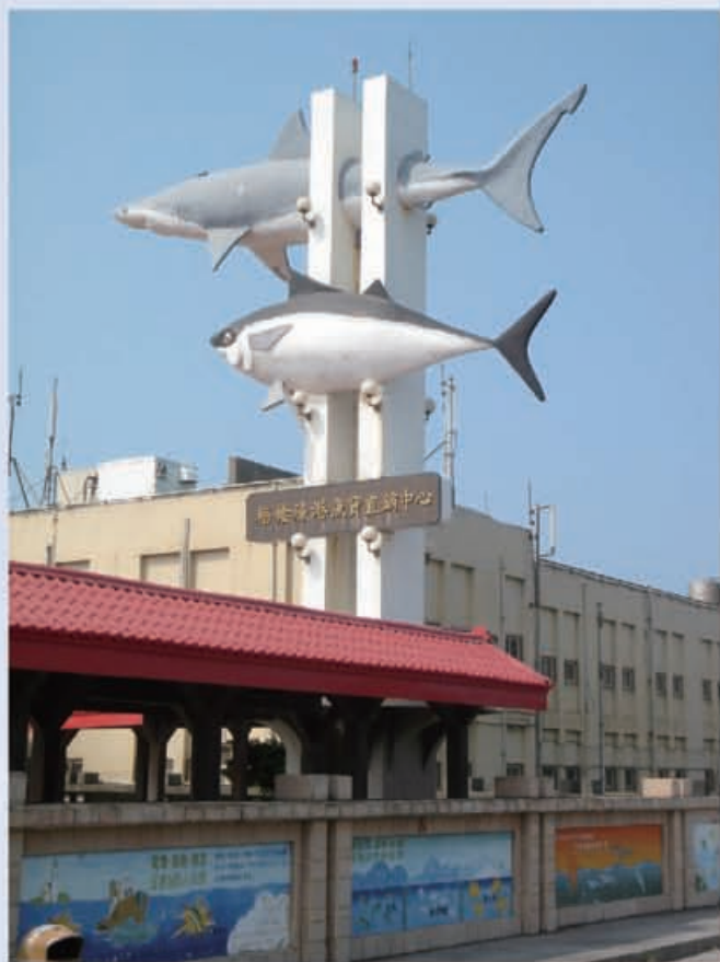
梧棲觀光漁港漁會地標

公園與各項娛樂休閒設施，是國人調劑身心、徜徉流連、知性旅遊的好地方。近年來漁會致力發展休閒漁業，吸引大量遊客，每逢假日更是車水馬龍，遊客絡繹不絕，改善漁民生活，同時也為漁會經營休閒漁業建立新的模式。