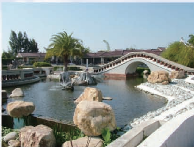
台中縣立港區藝術中心

港區藝術中心同時創設「台中縣美術家資料館」，於民國 90 年 11 月 4 日開館，以蒐集、整理、儲存、展示，提供台中縣美術家之藝術成就以及相關圖文資料為宗旨。目前中心因應中部科學園區成立，建置雙語網頁、印製雙語展演簡介，並積極培訓英語導覽人員，以服務參與藝文活動之國外人士。同時配合園區夜間景觀，研擬辦理戶外廣場夜間藝文活動，或展覽廳假日夜間延長開放服務的整體可行性。