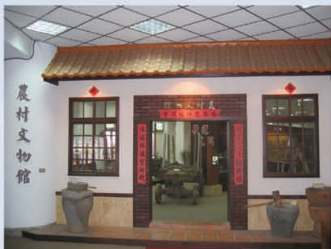
清水鎮農村文物館

民國八十年六月很順利的設立農村文物館，總面積二七〇平方公尺，由熱心人士 152 人無償贈供農村文物及生活物品達 1104 件。依用途及傳統習俗分為生產用具、生活用具、大廳用品、農業副業工具、臥室用品、捕魚工具、廚房用具、飯廳用具、整地農具、插秧農具、中耕除草農具、收穫農具、運輸工具、灌溉工具、草藥用具等十七類展示。內容充分表現出昔日農村文化之演進。也讓後代子孫及參觀貴賓一踏進文物館時好像走入時光隧道。感念祖先辛勤耕作，對社會人群所作的貢獻，為發展農業所付出的心血之情油然而生，亦藉以對照古今農具和生活物品之演進歷史及古今生活之對照。