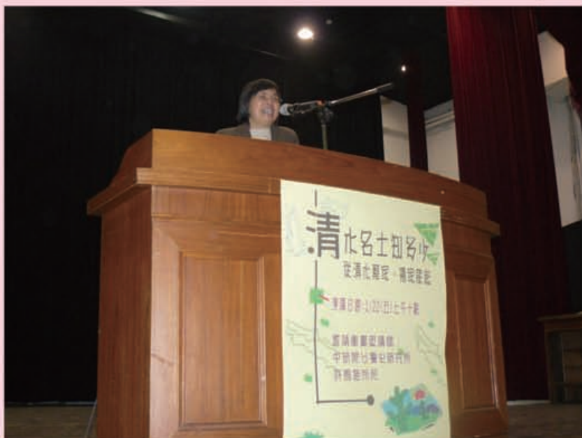
99.1.22 於清水高中大禮堂