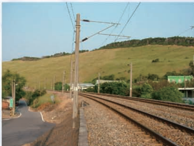
五福圳自行車道起點

五福圳又名大甲溪圳或窩熬頭圳是清水最主要的農田灌溉溝渠，為清雍正十一年（1733）所開鑿，由大甲溪南岸楊厝寮一帶取水，灌溉清水、沙鹿、梧棲一帶之農田。石瀨頭橋於民國六十八年元月竣工，是相當具有特色的一座橋樑，它的可貴在於保留了當地的「土名」石瀨頭，它的美及特色在於它巧妙地利用當地地形的特殊需求，它需從米粉寮大排水溝上面及海線縱貫鐵道下面經過，十分創意有趣。湳山寺的主神是以十歲童齡成佛的「廣澤尊王」，所以神像造型是屬於兒童的臉型，神像的特徵是以右腳單腳打坐，因在清同治年間受清世宗封為「廣澤尊王」，所以可以穿戴蟒袍。玉聖寺創建於清咸豐年間〔1851~1861〕，而今日之面貌是民國四十八年改建而得的，玉聖寺是以齊天大聖為主神的廟宇，在全省也不多見，因這座廟宇的關係，所以這裡的地名又叫「大聖爺庄」，在廟的後方還有一間土地公廟，廟旁長了一顆大大的木棉樹。