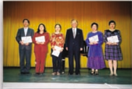
王甲乙董事頒發大學優秀水晶獎座