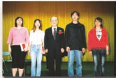
◀ 大學助學金 楊董事長頒發