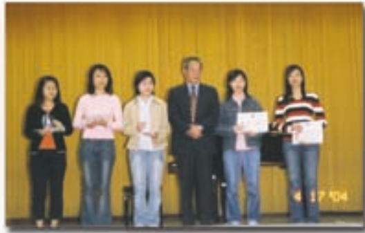
大學優秀水晶獎座 蔡嘉蔭議員頒發