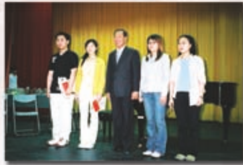
◀ 黃縣長頒發大學助學金